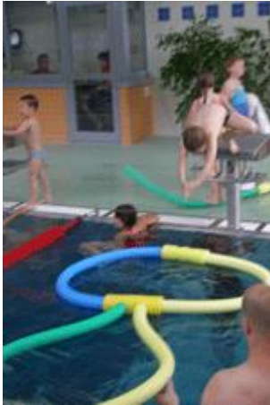
wieder mal Sprünge