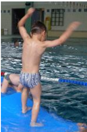
Timi hält die Großen in Schach