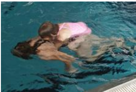
Suchbild mit Kids