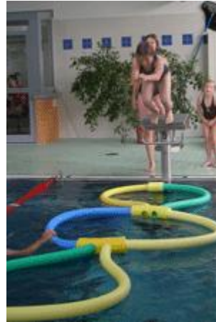
Sprünge ohne Ende