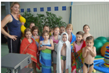
GROßES BIENCHEN AN ALLE!!!