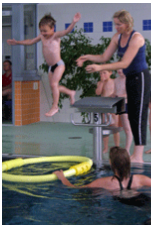
und der Kleinste unter all den Enten springt natürlich mit!!!