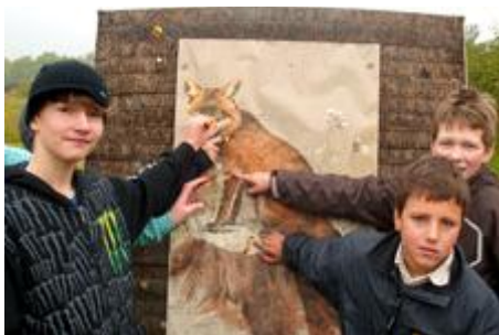
Ganz stolz: Mitten in den Fuchs!