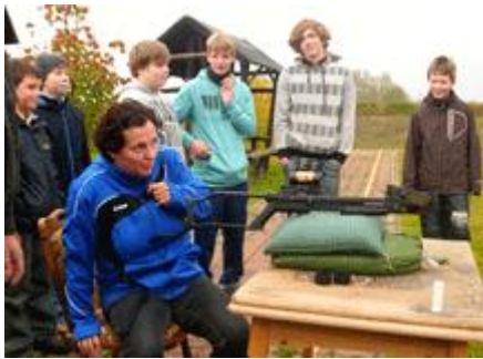
...mit sichtlich viel Spass!