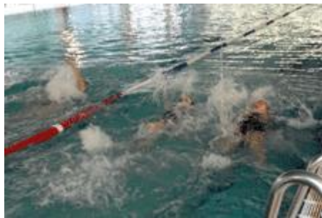
Intensive Wettkampfvorbereitung und dann los mit voller Konzentration.