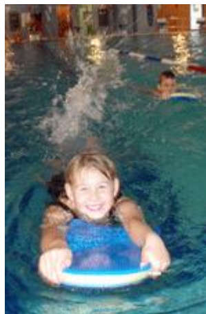
leider nicht mit allerletztem

Einsatz, aber doch großen Fortschritten im gesamten Zeitraum des Trainingslagers.