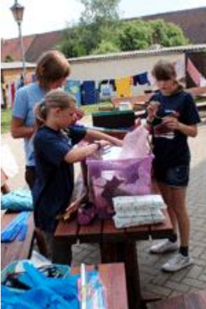
Es entstanden die ersten Sachen fürs Neptunfest.