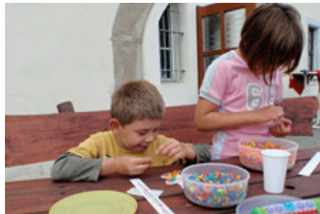
was zu unserer