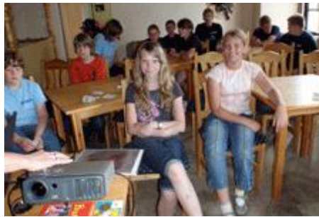
Der Vortrag für die Älteren war etwas ausführlicher und gab unseren jungen Sportlern viel Zeit zum Basteln,