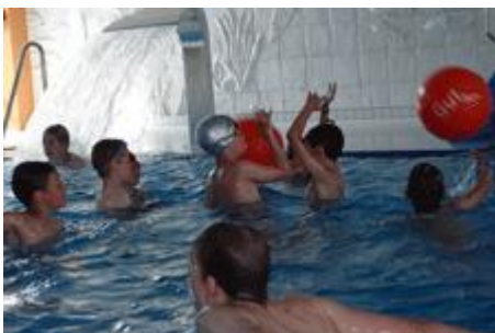
Planschen im kleinen Becken