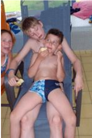
Tom auf Jonas und