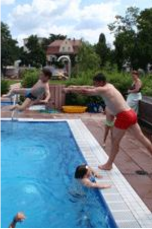
mit verschiedenen „Opfern“.