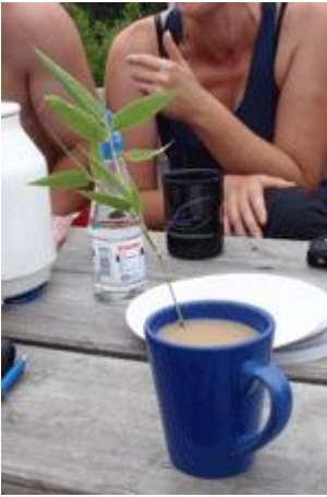
Löffelersatz und belegter Mike

Bei so viel Blödelei und nach so langer Zeit breitete sich dann auch bei den Erwachsenen der Lagerkoller aus. Dies war beim Kaffeetrinken deutlich zu beobachten: