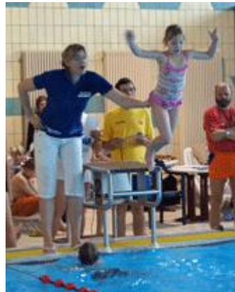
Die Eltern und Betreuer halfen bei den Wechseln kräftig mit.