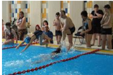
Wechsel auf Ellen