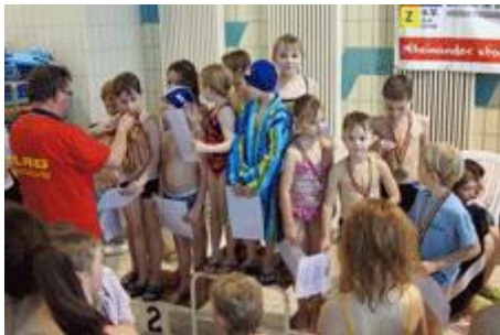
Kategorie 2.Klasse- 3. Platz