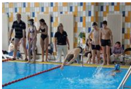
Wechsel auf Alex