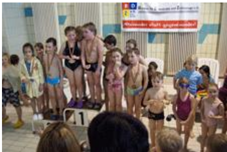
Kategorie 1.Klasse- vierter Platz

Hier nun die Bilder der ersten Siegerehrungen: