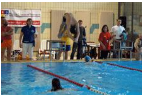
und dann auf Vincent