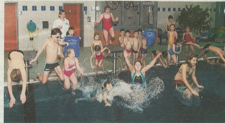
Da freut sich auch der Nachwuchs: Die Eilenburger Schwimmer beim ersten Training unter dem Dach des SSV.