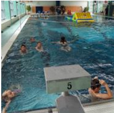
Letzter Freitags-Trainingstag in diesem Schuljahr- da kommt nach sechs Bahnen Einschwimmen...