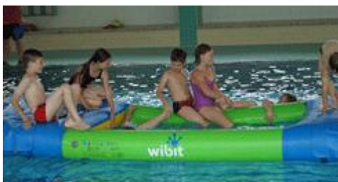
... auf der neuen Spielstrecke...