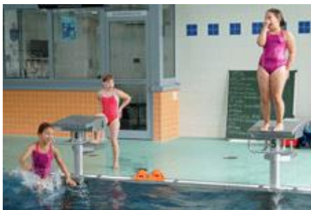
Einige Mädchen sprangen erst vom Startblock und später vom Turm.