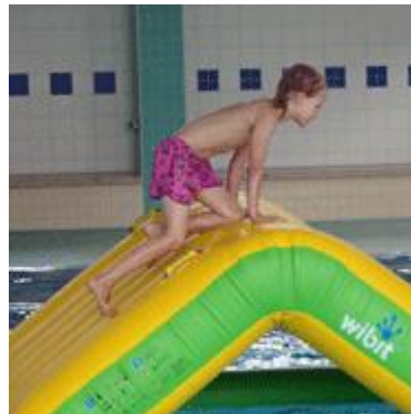
... mit der freundlichen Unterstützung des Schwimmhallenteams eine ganze Spielstunde...