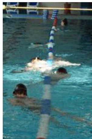
und das Ganze auch in der Rückenlage...