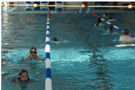
Tauchen unter der Leine hindurch

Die Haie bekamen heute andere Aufgaben als ihre „Vorgänger“