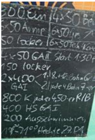
Das Programm der Hechte startete mit kurzen Strecken und endete mit langem GAI-Schwimmen und insgesamt 4 Kilometern.