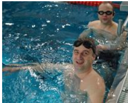
Die kräftigen Jungs der Nemos wurden beim Stationstraining von den Erwachsenen bestaunt.