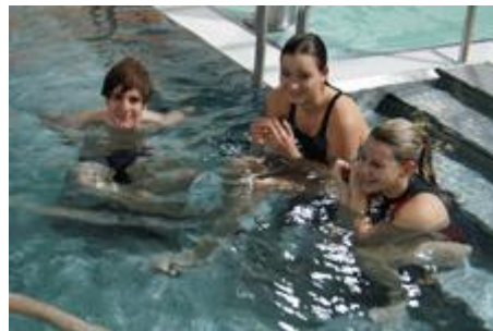
... und hatten sich damit ein wenig Erholung und Entspannung verdient!