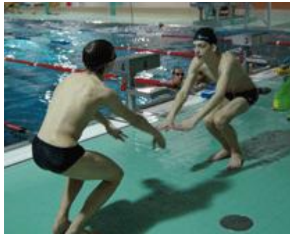
Hintereinander weg- bis zu siebenmal absolvierten die Jugendlichen das Programm...