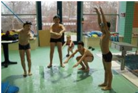
Den Start machten die Enten .