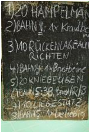
Am Nachmittag galt diese Tafel für fast alle Gruppen.