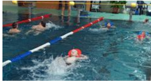
Nach jedem Schwimmen galt es eine Kraftstation an Land zu absolvieren...