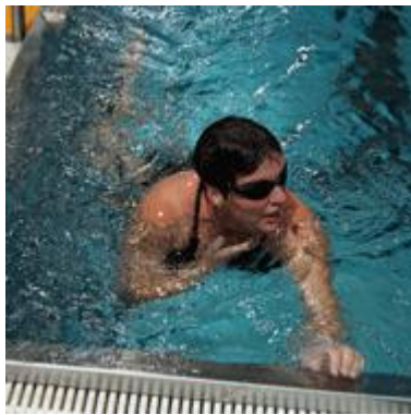
Fleißig am Trainieren: