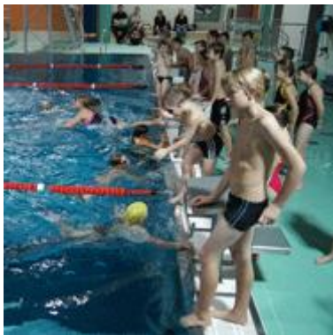
Ob groß oder klein- alle gaben sich viel Mühe und hatten offensichtlich Spaß an dieser ungewöhnlichen Trainingsform.