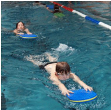
Ähnlich waren auch die Aufgaben für die anderen Bein- oder Armbewegungen.