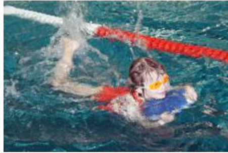
Mit viel Eifer und ihren jeweiligen Fertigkeiten versuchten alle ihre Staffel nach vorn zu bringen...