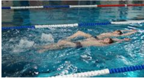
Die Haie versuchten sich am Anfang an Technikaufgaben, wie Rückenbeine mit so wenig Beinschlägen, wie möglich.