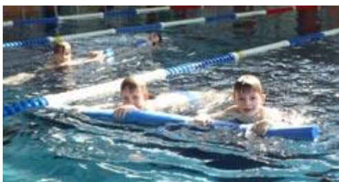
Die Mäuse schwammen inzwischen ebenfalls zu zweit an einer Nudel.