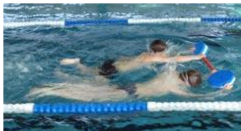
Aber auch bei den Jungs ging es dann ordentlich zur Sache.