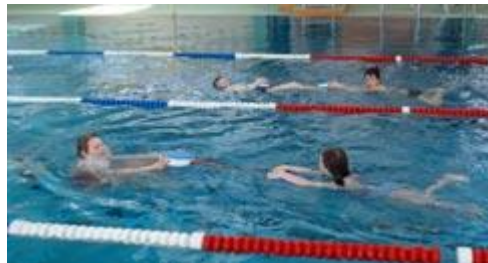
Sehr viel Spaß hatten die Kinder, als die Sprosse längs zwischen ihnen mitgenommen werden mußte...