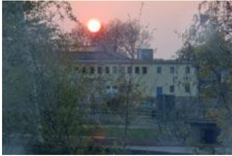
Sonne zur Nacht - das Sportlerherz lacht...

Frohe Ostern und ein paar sonnige Tage wünschen Euch allen