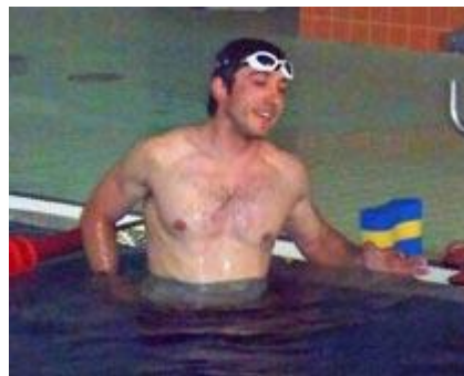
Die großen Jungs hatten heute ein sehr abwechslungsreiches, aber auch anstrengendes Programm...