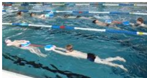
Um endlich zum Spielen zu kommen, gaben sich alle bei der letzten Übung mit der Sprosse ordentlich Mühe.