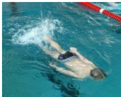
Auch die Kleinsten probierten sich dann am Tauchen, wobei man vollständig unter Wasser bleiben sollte...