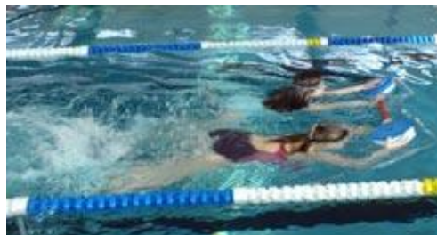
Selbst Delphinbeine als Paar war keine Schwierigkeit für unsere Mädchen!!